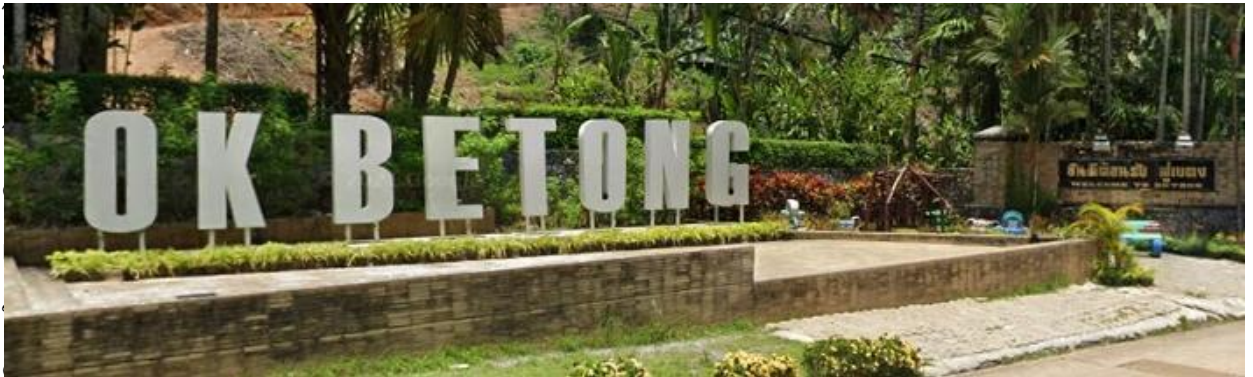
อินสุตฮิต ถ่ายภาพกับ ป้ายโอเคเบตง

นำท่านเดินทางต่อไปยัง อำเภอเบตง อำเภอเล็ก ๆ ในจังหวัดยะลา (ระยะทาง 150 ก.ม. ใช้เวลาเดินทาง 3 ชั่วโมง โดยประมาณ) เบตง จัดเป็นอำเภอหนึ่งที่มีเอกลักษณ์ ความงดงาม ความหลากหลายทางวัฒนธรรม ความเชื่อ ความศรัทธา และเชื้อชาติที่หลากหลายที่ผสมปนเปกันภายใต้ความเป็นหนึ่งเดียว จนทำให้บรรดาผู้มาเยือนต่างหลงใหลและแปลกใจ เบตง ตั้งอยู่ที่ใต้สุดฝั่งตะวันตกของประเทศไทย มีเขตแดนติดกับประเทศมาเลเซีย โอบล้อมด้วยแนวเทือกเขาสันกาลาคีรี ภูมิประเทศของอำเภอเบตง ด้วยภูมิประเทศแบบนี้จึงทำให้เบตงมีอากาศที่ดี อากาศเย็น และมีหมอกปกคลุมตลอดทั้งปี ดังคำขวัญประจำอำเภอที่ว่า “เมืองในหมอก ดอกไม้งาม ใต้สุดสยาม เมืองงามชายแดน” คำว่า เบตง มาจากภาษามลายู "Buluh Betong" หมายถึง "ไม้ไผ่ขนาดใหญ่" หรือที่คนในพื้นที่จะเรียกไผ่ชนิดนี้ว่า ไผ่ตง ดังนั้นต้นไผ่ตงจึงกลายเป็นสัญลักษณ์หนึ่งของอำเภอเบตง ระหว่างทางนำท่านจอดแวะถ่ายรูปบริเวณ สะพานข้ามเขื่อนบางลาง บริเวณบ้านคอกช้าง อ.ธารโต สะพานแห่งนี้สร้างขึ้นมาเพื่อล่นระยะทางในการเดินทาง จากเดิมที่จะต้องไปตามไหล่เขา ซึ่งเป็นส่วนหนึ่งของทางหลวงหมายเลข 410 ยะลา-เบตง เป็นจุดที่นักท่องเที่ยวนิยมแวะพักถ่ายรูปและยืดเส้นยืดสายก่อนจะเดินทางต่อ จากนั้นนำท่าน แ